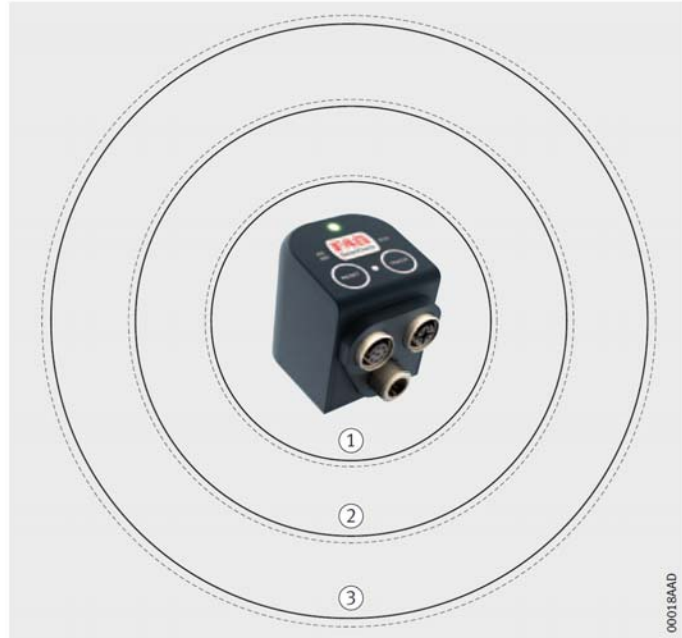
Рис. 4 Концепция уровней