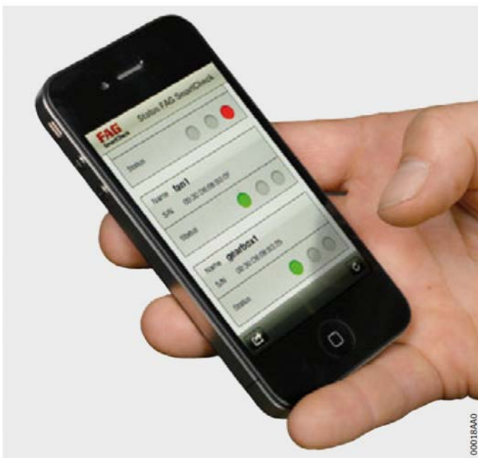
Рис. 2 Смартфон в качестве приемника сигналов тревоги

Заявленное на получение патента средство автоматической адаптации порога срабатывания сигнализации обеспечивает надежное оповещение. Светодиод на устройстве сразу отображает сигнал тревоги. С помощью интерфейсов этот сигнал может передаваться к пульту управления. Бесплатное приложение превратит любой смартфон в приемник сигналов тревоги в сети WLAN, рис. 2 .